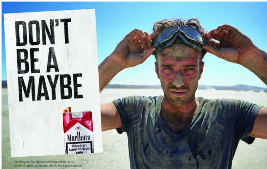
Rauchen kann tödlich sein. Der Rauch einer Zigarette dieser Marke enthält 10 mg Teer, 0,8 mg Nikotin und 10 mg Kohlenmonoxid. (Durchschnittswerte nach ISO)